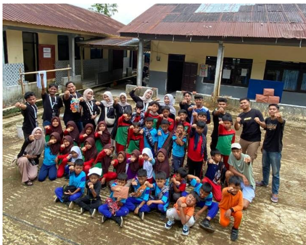
Gambar 9. Lomba Hari Santi Nasional bersama Pemuda-pemudi Cokrowati di SD Kasimpar

memperkuat peran pemuda dalam mendukung kegiatan pendidikan dan pembinaan generasi muda di lingkungan desa.