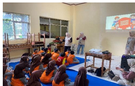
Gambar 7. Sosialisasi pengelolaan sampah di SDN Kecil Kasimpar