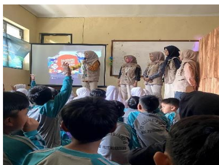
Gambar 6. Sosialisasi pengelolaan sampah di SDN Kasimpar

Selain itu, kegiatan ini juga bertujuan untuk menyadarkan anak-anak akan pentingnya pengelolaan sampah yang tepat agar tidak terjadi penumpukan sampah di pinggir jalan maupun di aliran sungai yang dapat mencemari lingkungan dan mengganggu kesehatan. Dengan adanya edukasi ini, diharapkan siswa-siswi mampu menerapkan kebiasaan hidup bersih dalam kehidupan sehari-hari serta menjadi agen perubahan dalam menjaga kebersihan lingkungan sekolah dan masyarakat sekitar.